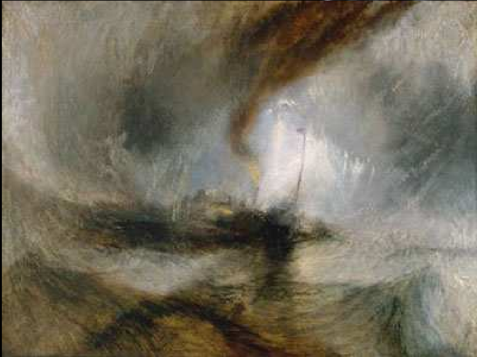
Joseph William Turner, Snow storm - Steam-boat off a Harbour Mouth - 1842